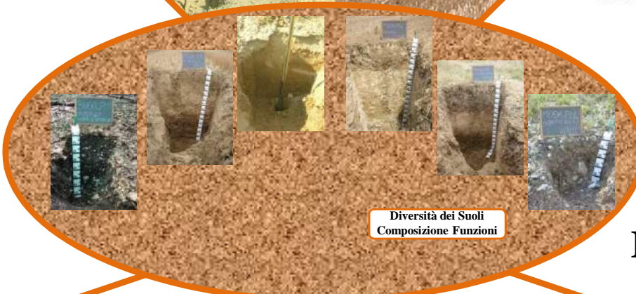
Diversità dei Suoli Composizione Funzioni

Servizio Ambiente e Agricoltura, PO Monitoraggio Suoli (Sede decentrata Treia) Tel./fax. 0733 - 217285 Mail: infosuoli@regione.marche.it Web: http://agricoltura.regione.marche.it http://suoli.regione.marche.it/